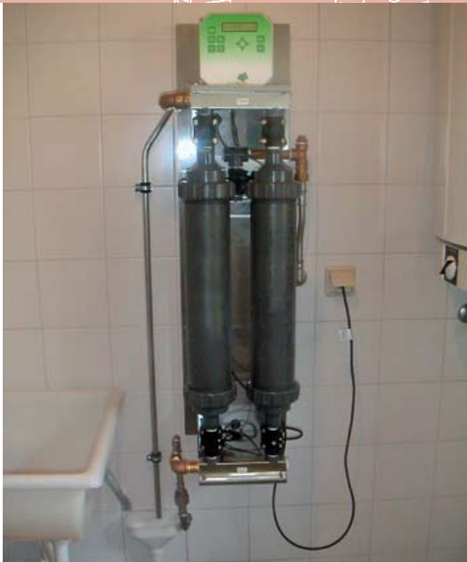
■ Die Ultrafiltration wird wie ein normaler rückspülbarer Filter einfach in die Trinkwasserleitung installiert. Zusätzlich muss der Spülwasseranschluss der Anlage mit einem Abfluss verbunden werden.

biker kehren im Schnitt an schönen Tagen dort ein und lassen sich Bier und Brotzeit schmecken. An solchen Tagen ist der Wasserbedarf der Hütte besonders hoch – Essen muss zubereitet, das Geschirr muss gespült und die Tische müssen saubergemacht werden. Eine zentrale Wasserversorgung ist dort allerdings weit und breit nicht vorhanden. Das für Bad, Küche und Milchammer genutzte Wasser ist Oberflächenwasser, das von Natur aus trüb ist und eine hohe Verkeimung aufweist. Sauberes Trinkwasser war auf der Hütte daher lange Zeit ein Problem.