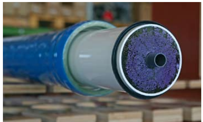
■ Querschnitt durch ein Ultrafiltrationsmodul mit den charakteristischen Hohlfaser-Membranen.

dichte – also der Membranfläche pro umbautem Raum – gewährleistet. Diese Hohlfasern verfügen meist über einen Innendurchmesser von 0,8 bis 0,9 mm. „Damit wir den Bruch dieser Fasern im Betrieb ausschließen und so eine zuverlässige und langfristige Rückhaltung aller Krankheitserreger sicherstellen können, verwenden wir in unseren Filteranlagen Membranen, bei denen sieben Hohlfasern zu einer zusammengefasst werden“, so Hank. „Hunderte dieser Fasern bilden dann wiederum ein Filterelement.“ Während der Filtration wird das Wasser in die Hohlfaserkapillaren des Filters gedrückt. Durch entsprechende Schaltung der Ventile der Filteranlage kann das Wasser nicht am anderen Ende der Hohlfaser austreten, sondern muss durch die Wand der Kapillare, also den eigentlichen Filter strömen. Durch ihre geringe Größe bilden die Filtermembranen eine nahezu hundertprozentige Barriere gegen Viren, Parasiten, Bakterien, Legionellen, Würmer und Sporen. Zusätzlich werden im selben Schritt Trübungen und Rotfärbungen aus dem Wasser entfernt. Selbst ein Durchbruch von Trübung oder Krankheitserregern sei damit ausgeschlossen: Steigt die Belastung des Rohwassers, beispielsweise nach einem Regenereignis,